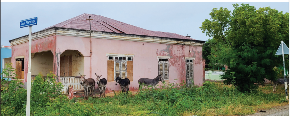
Burikunan ta skonde awa kantu di muraya di kas, mientras tur hende ta den kas i awaseru di e mal tempu a yega Boneiru.